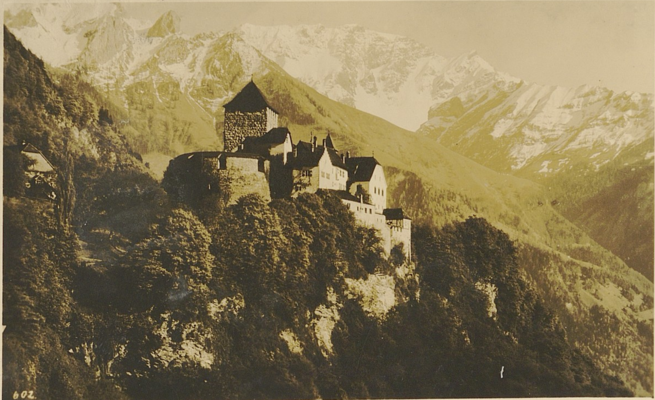
602. Schloss Vaduz, F. Liechtenstein